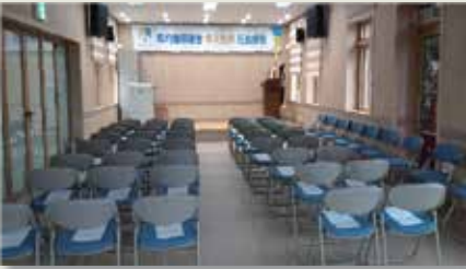
선비학당 대관 : 1회 2시간 기준