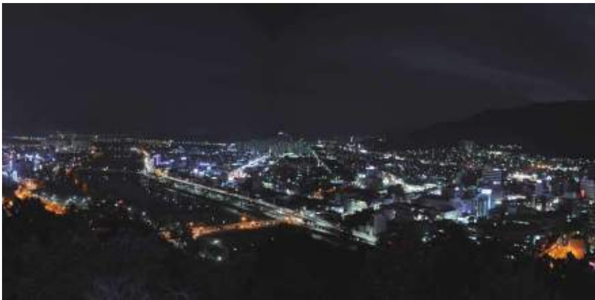
[그림1-1] 순천시 전경

야간경관의 창의적이고 효율적인 관리방안 마련을 통해 아시아 생태문화수도를 목표로 한 순천시의 정체성 강화 및 생태도시 이미지 제고